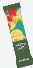
말차 라떼 스틱