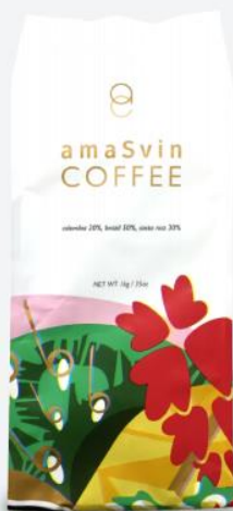
아마스빈 브랜드 원두