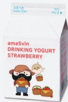
드링크링 과일 요거트